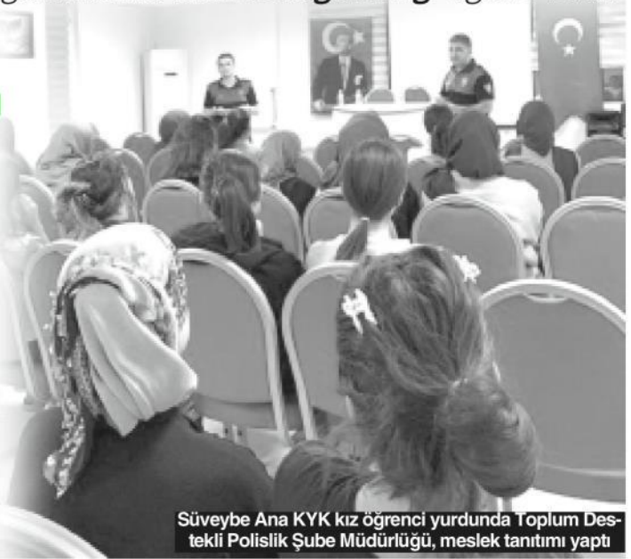
Süveybe Ana KYK kız öğrenci yurdu'nda Toplum Destekli Polislik Şube Müdürlüğü, meslek tanıtımı yaptı

Batman Özel Güvenlik Şube Müdürlüğü koordinesinde Batman Üniversitesi ve Gençlik Spor İl Müdürlüğü'ne bağlı yurtda görev yapan 100 Özel güvenlik görevlisi de 'KAAN' uygulaması kapsamında 'KYG' ve üniversite güvenliği eğitimi verildi. Batman Üniversitesi Merkez kampüsteki konferansta özel güvenlik görevlileri, uzmanları can kulağıyla dinledi. (Bünyamin Ayaz)